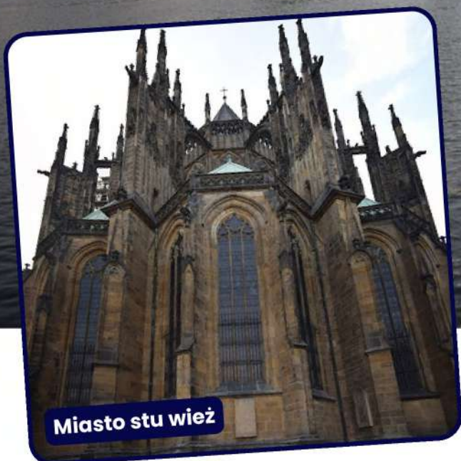
Miasto stu wież