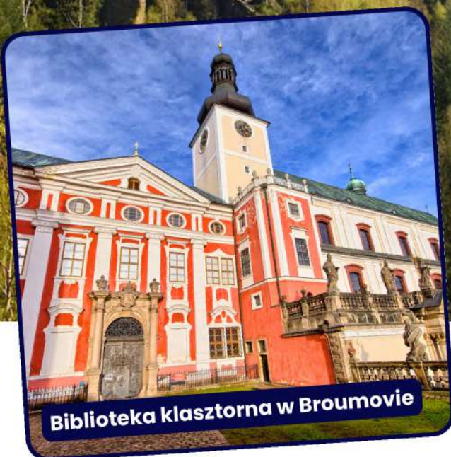
Biblioteka klasztorna w Broumovie