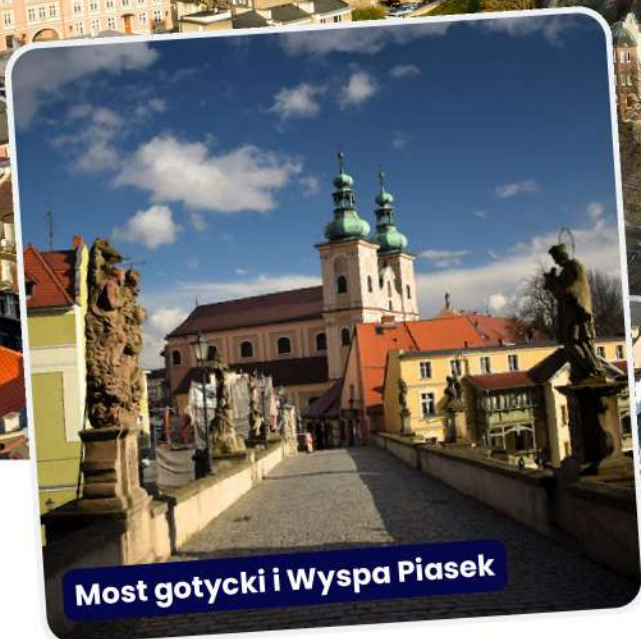
Most gotycki i Wyspa Piasek