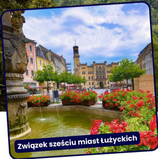
Związek sześciu miast Łużyckich