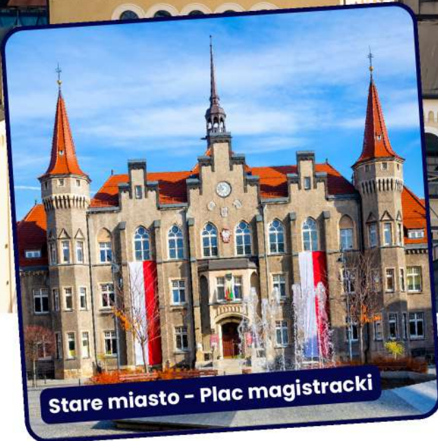
Stare miasto - Plac magistracki